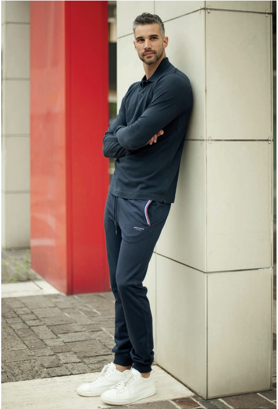
Art. 2Q865 polo Art. 2733F pantalone