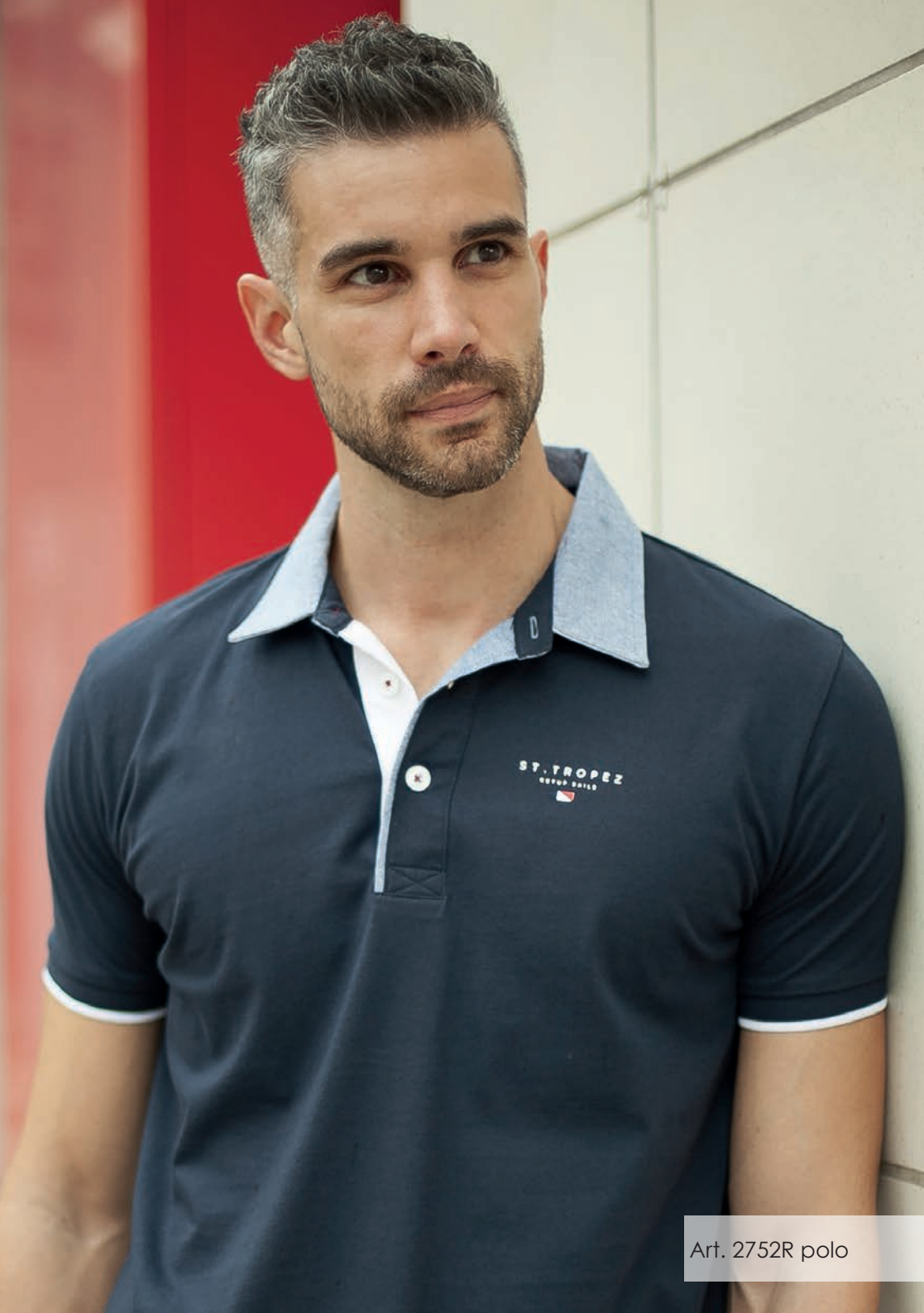
Art. 2752R polo