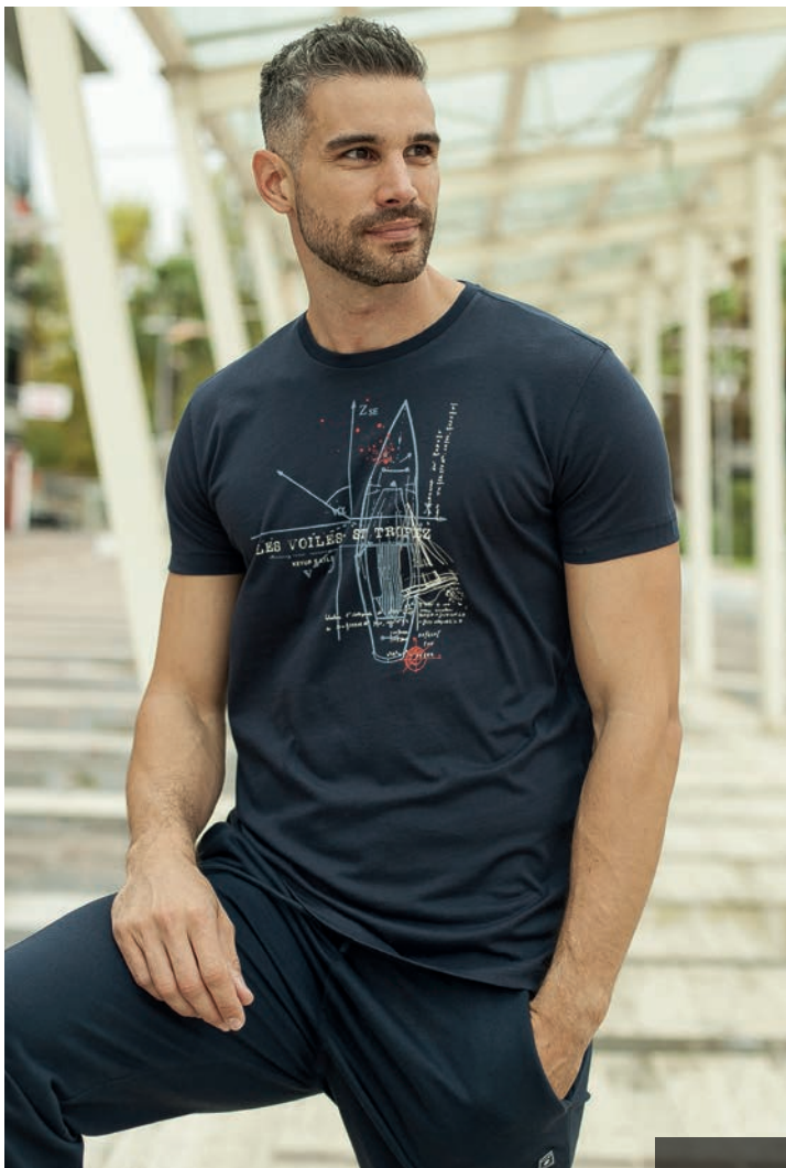
Art. 2711S t-shirt

“Ogni generazione ride delle mode vecchie, ma segue religiosamente quelle nuove.”