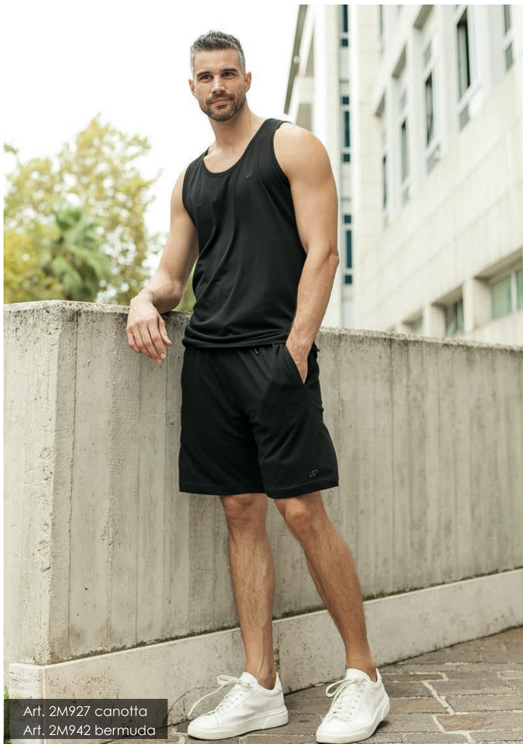
Art. 2M927 canotta Art. 2M942 bermuda