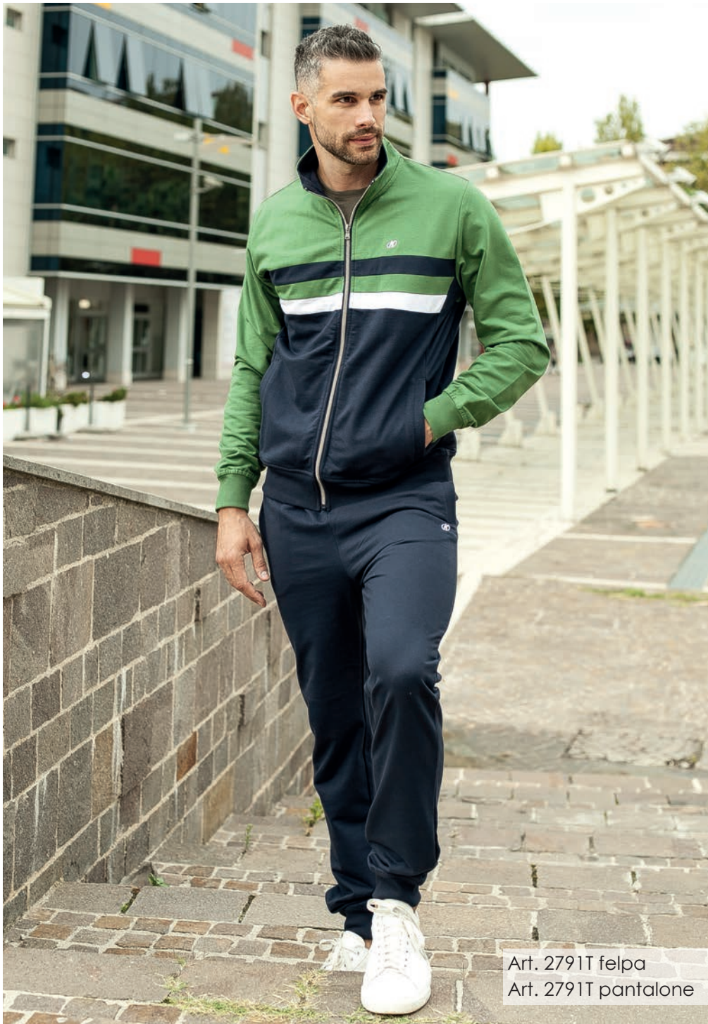
Art. 2791T felpa Art. 2791T pantalone