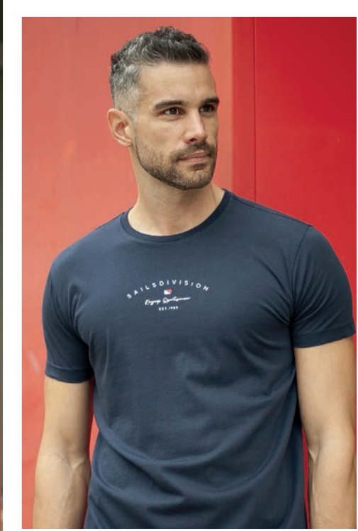
Art. 2701S T-Shirt Art. 2733F pantalone