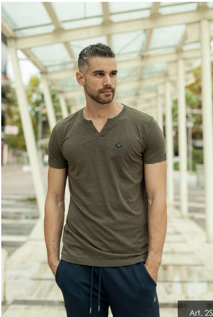
Art. 2S868 t-shirt

"La moda non e' qualcosa che esiste solo negli abiti. La moda e' nel cielo, nella strada, la moda ha a che fare con le idee, il nostro modo di vivere, che cosa sta accadendo."