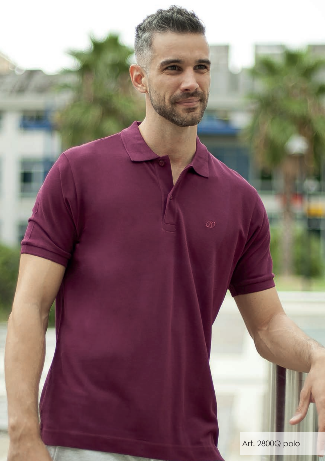
Art. 2800Q polo