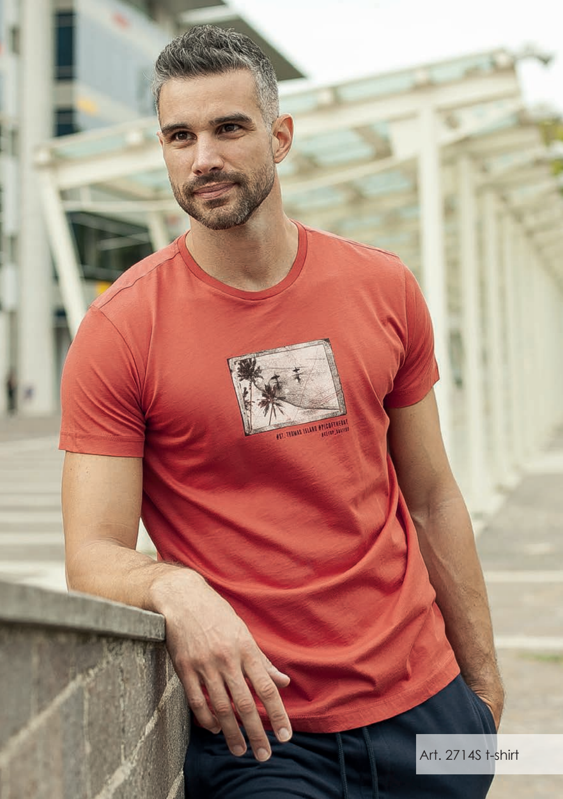
Art. 2714S t-shirt