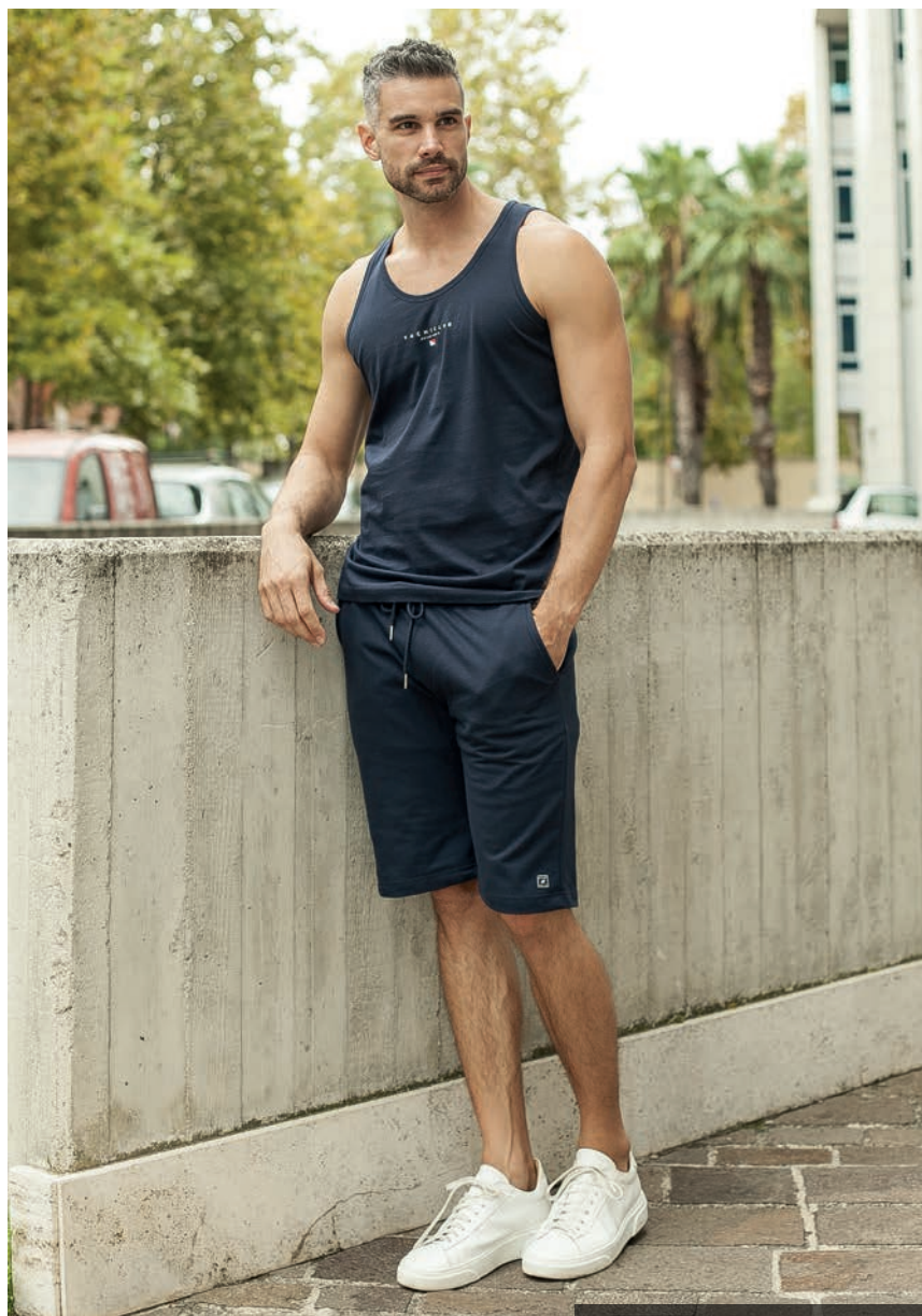
Art. 2712S canotta Art. 2F38E bermuda

“La moda e’ un balletto, lo spruzzo d’acqua nel parco, l’orchestra piu’ sublime dell’eleganza intuitiva..”