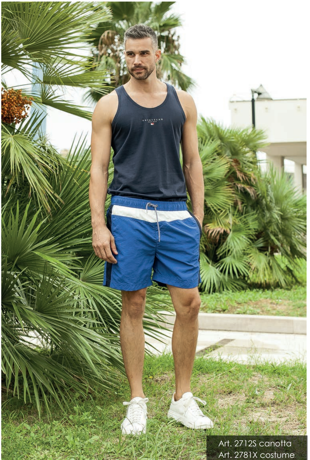
Art. 2712S canotta Art. 2781X costume