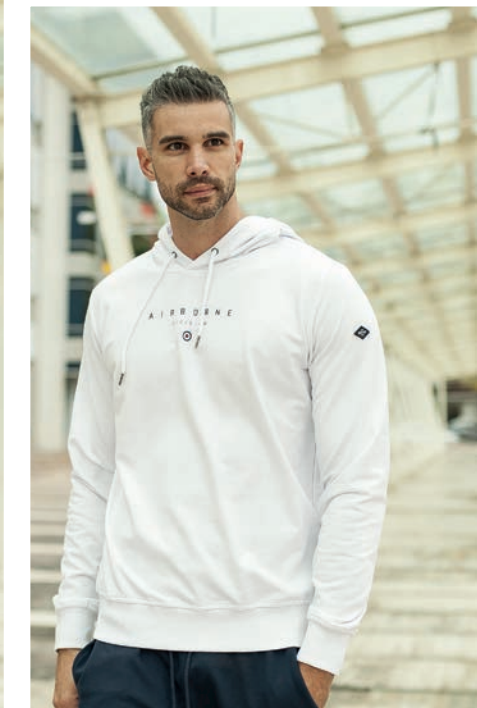
Art. 2736F felpa Art. 2F37E pantalone