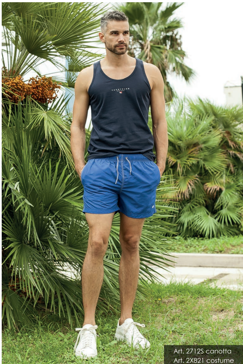
Art. 2712S canotta Art. 2X821 costume