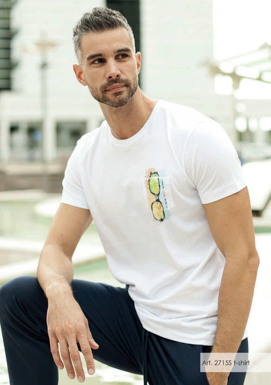
Art. 2715S t-shirt