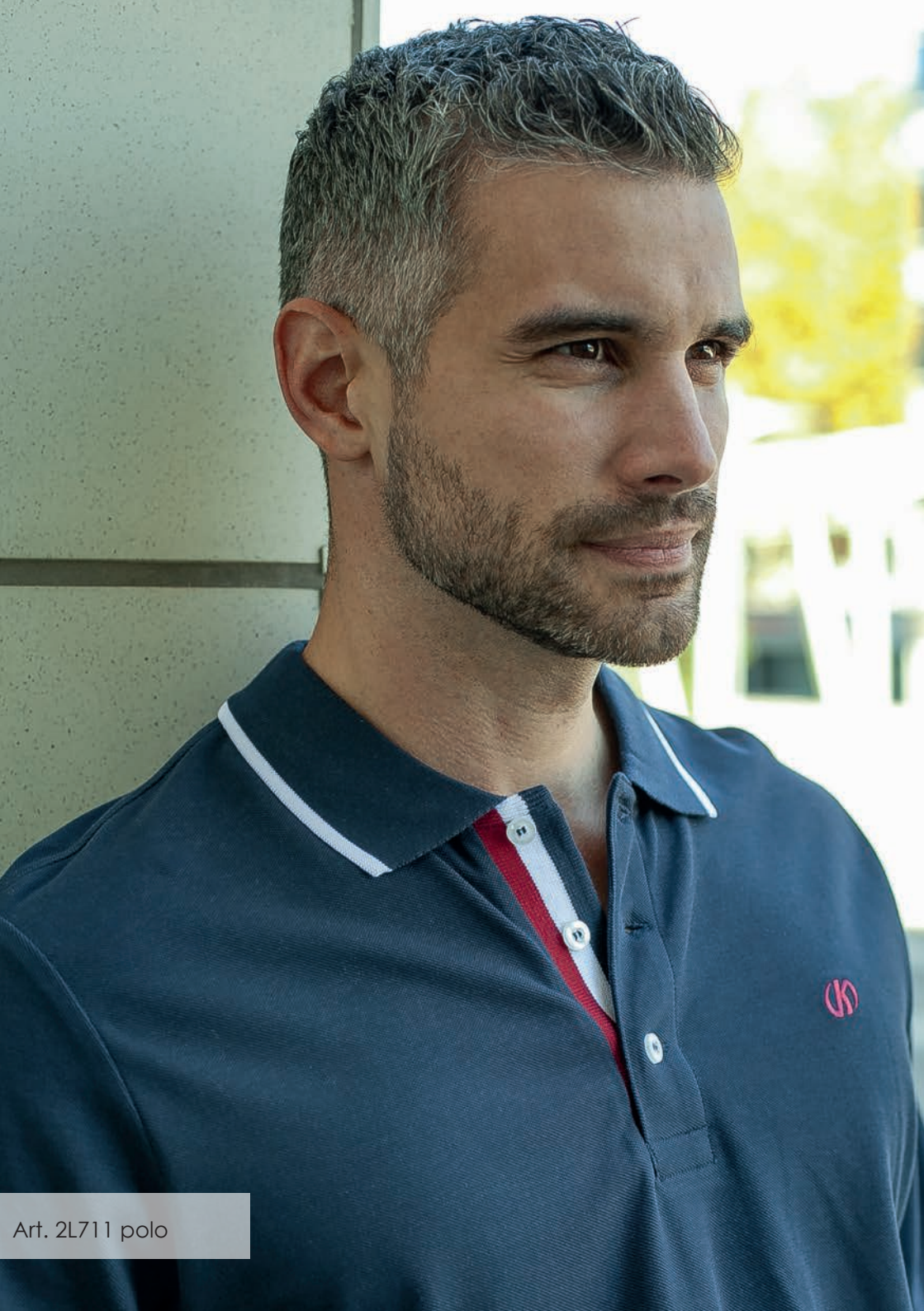
Art. 2L711 polo