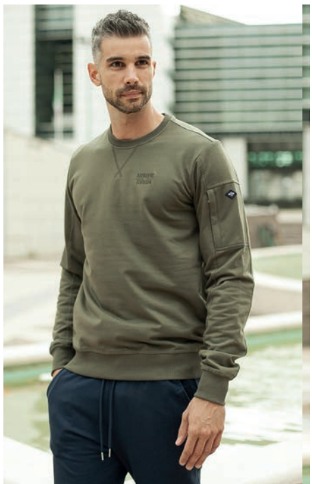
Art. 2739F felpa Art. 2F37E pantalone