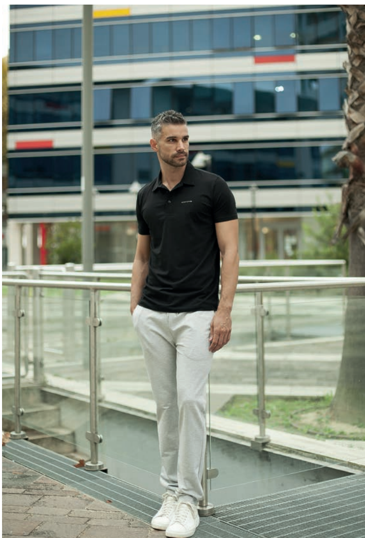
Art. 2755E polo Art. 2F36E pantalone

"La moda riflette i tempi in cui si vive, anche se, quando i tempi sono banali, preferiamo dimenticarlo."