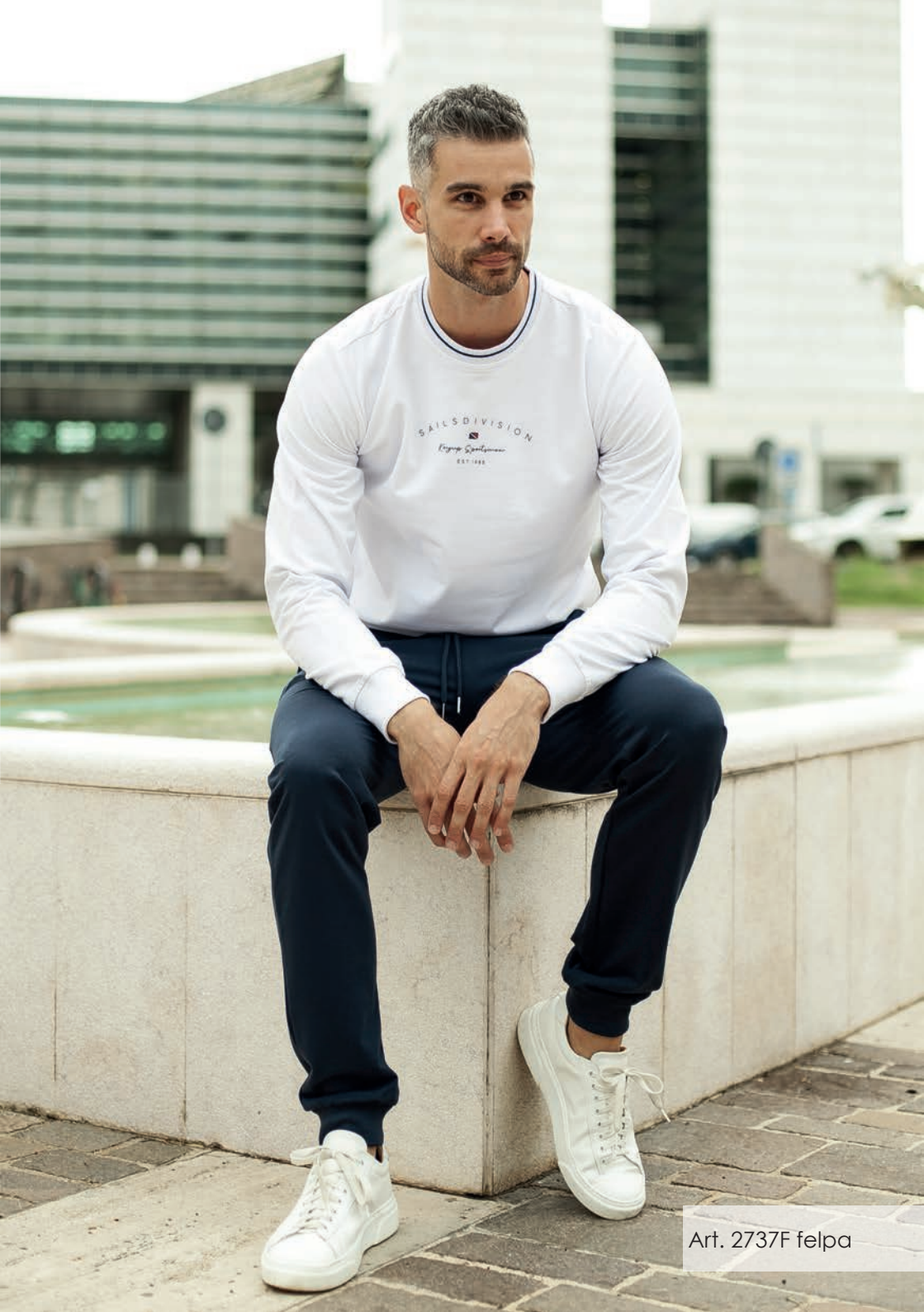
Art. 2737F felpa