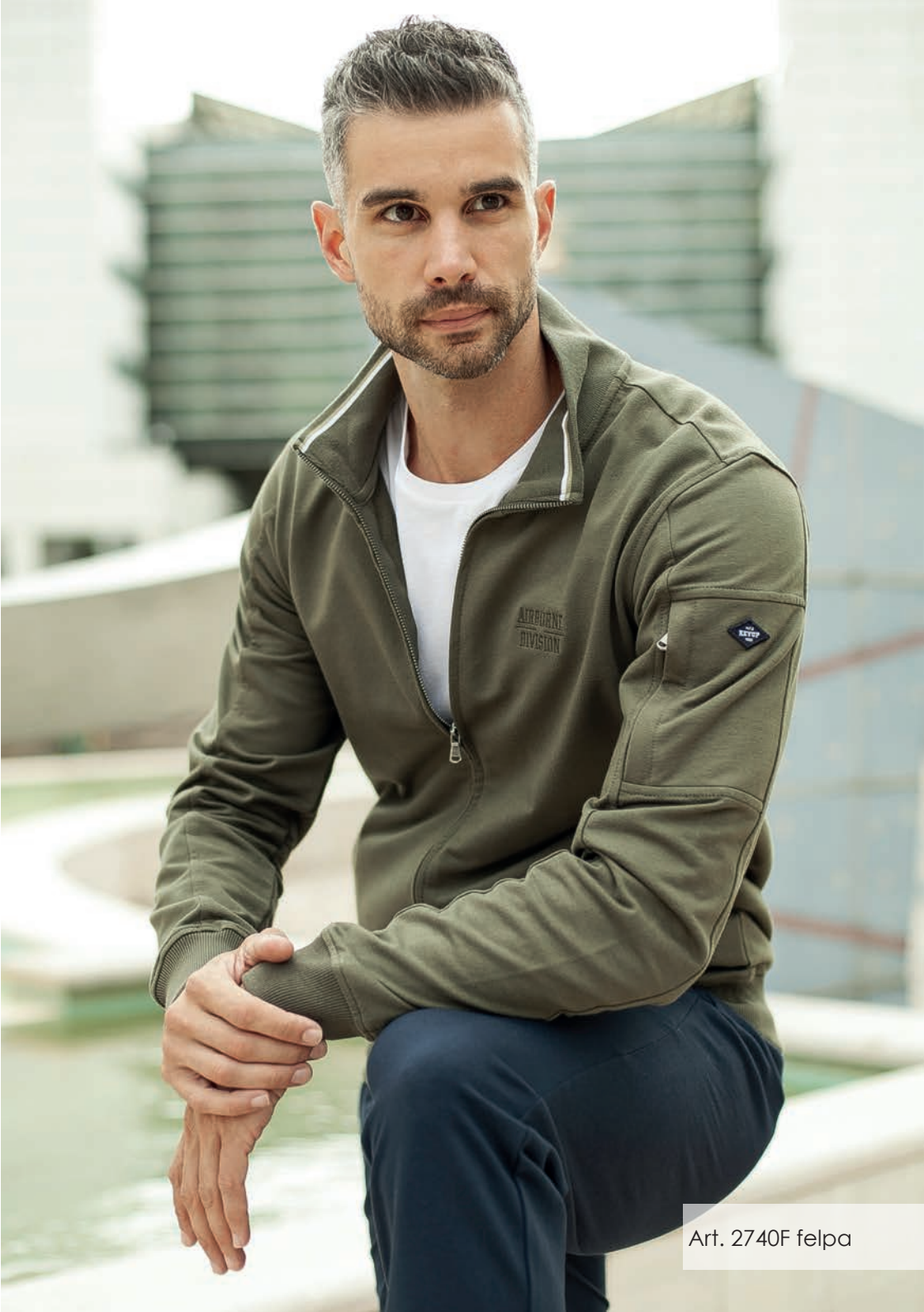
Art. 2740F felpa