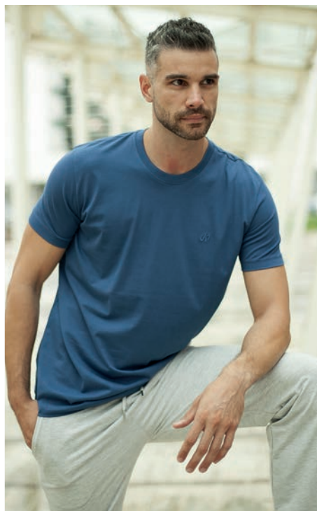
Art. 2M915 T-Shirt Art. 2F36E pantalone