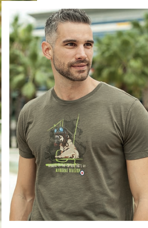
Art. 2722S t-Shirt Art. 2F37E pantalone