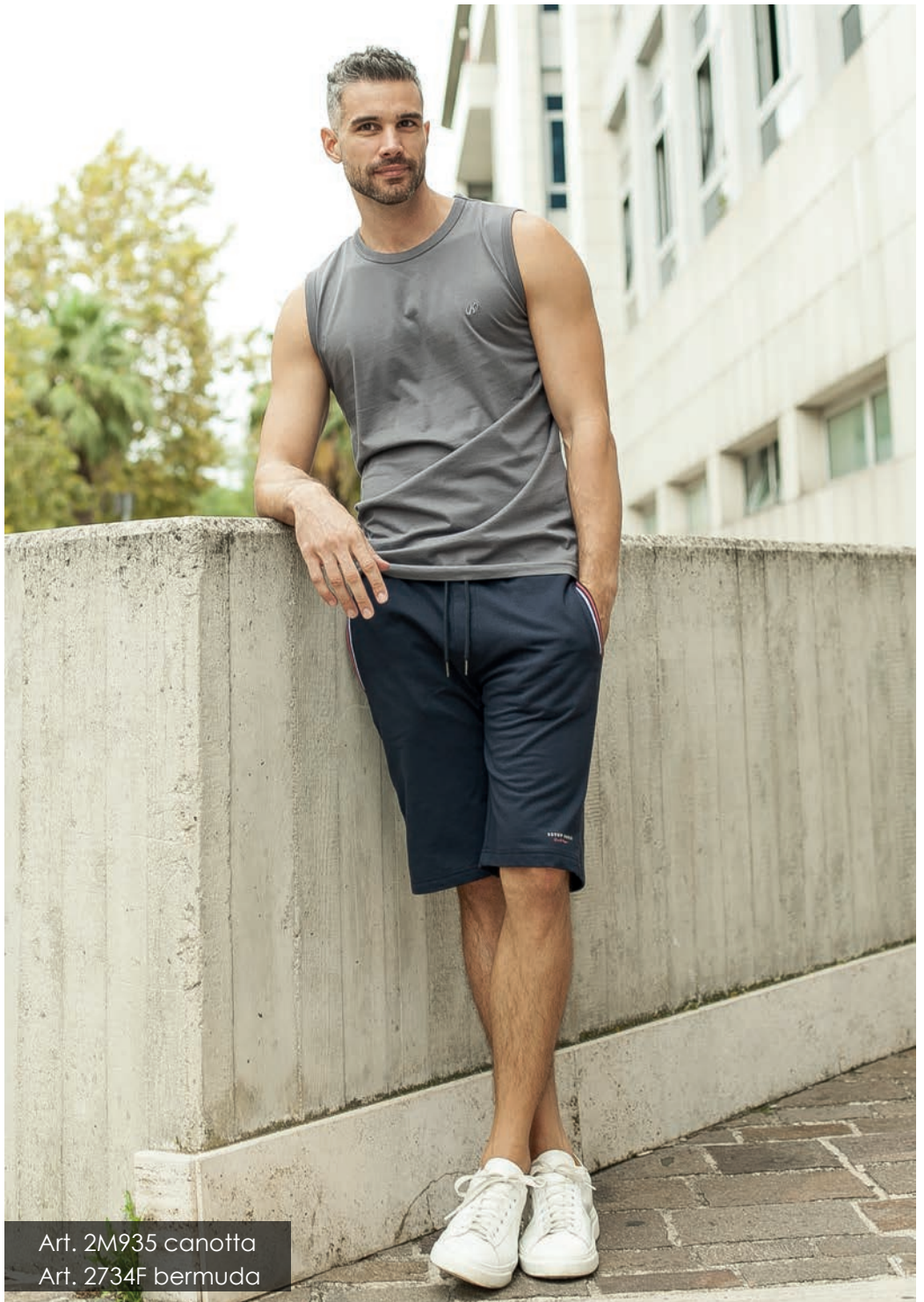
Art. 2M935 canotta Art. 2734F bermuda