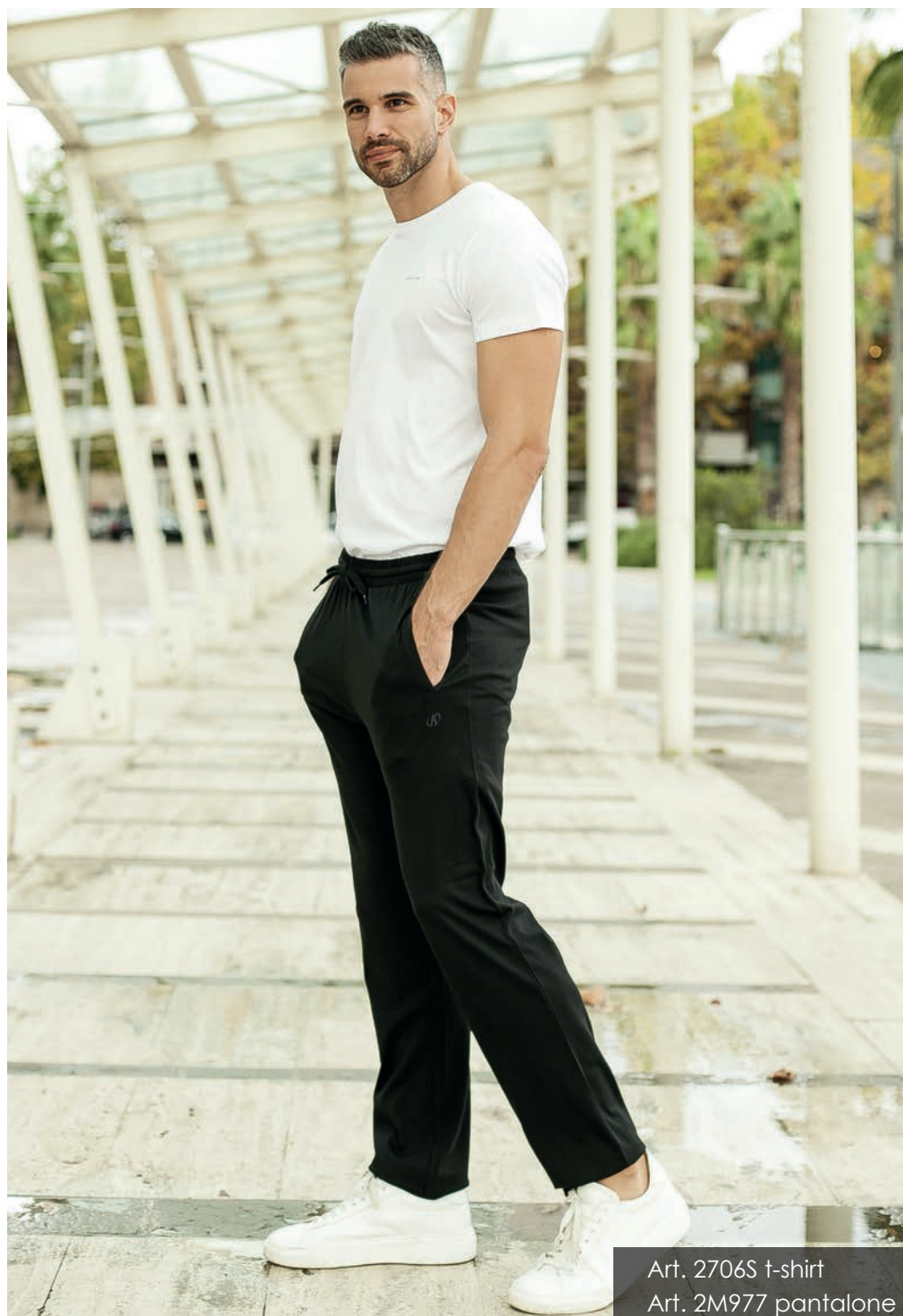
Art. 2706S t-shirt Art. 2M977 pantalone