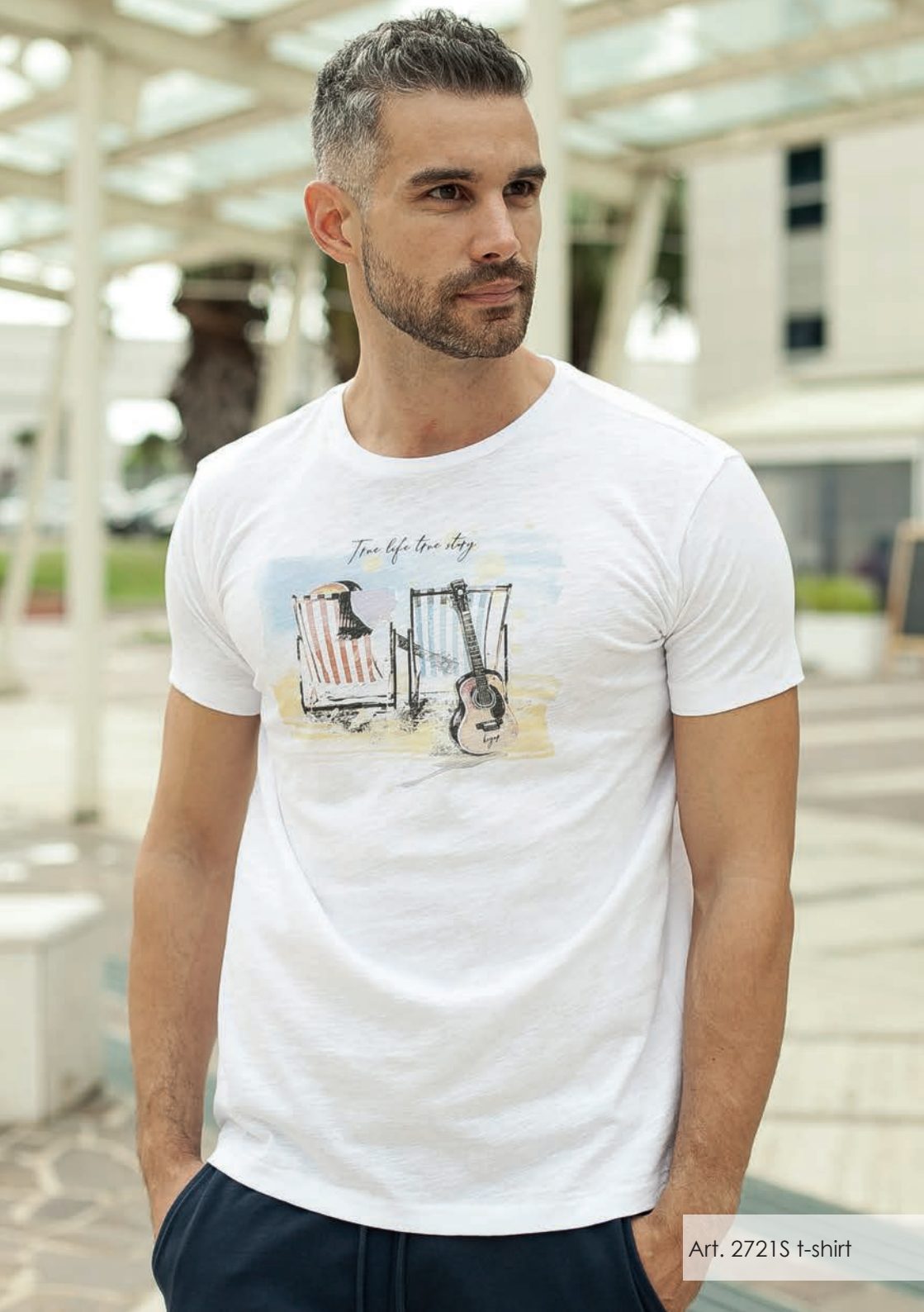
Art. 2721S t-shirt