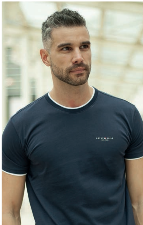
Art. 2707S T-Shirt Art. 2F36E pantalone