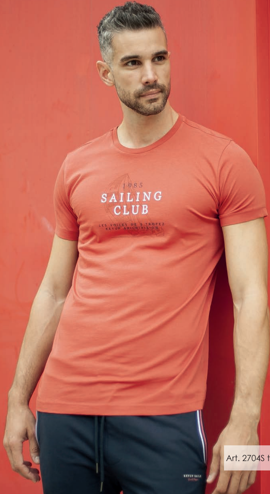
Art. 2704S t-shirt