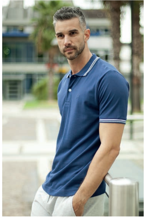
Art. 2Q70G polo Art. 2F36E pantalone