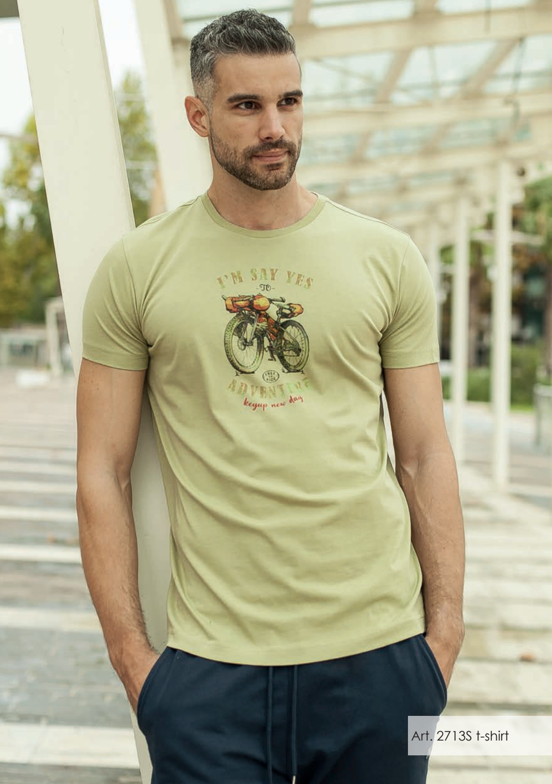
Art. 2713S t-shirt