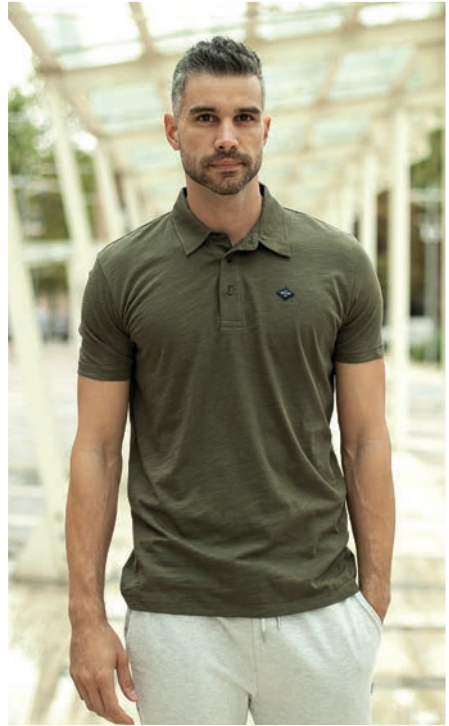
Art. 2750R polo Art. 2F36E pantalone