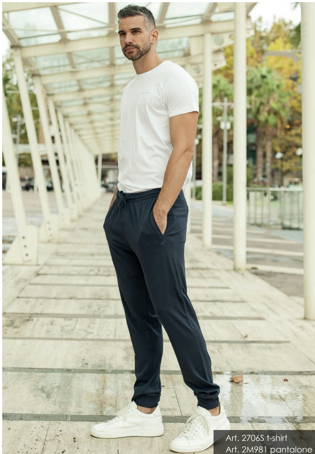
Art. 2706S t-shirt Art. 2M981 pantalone