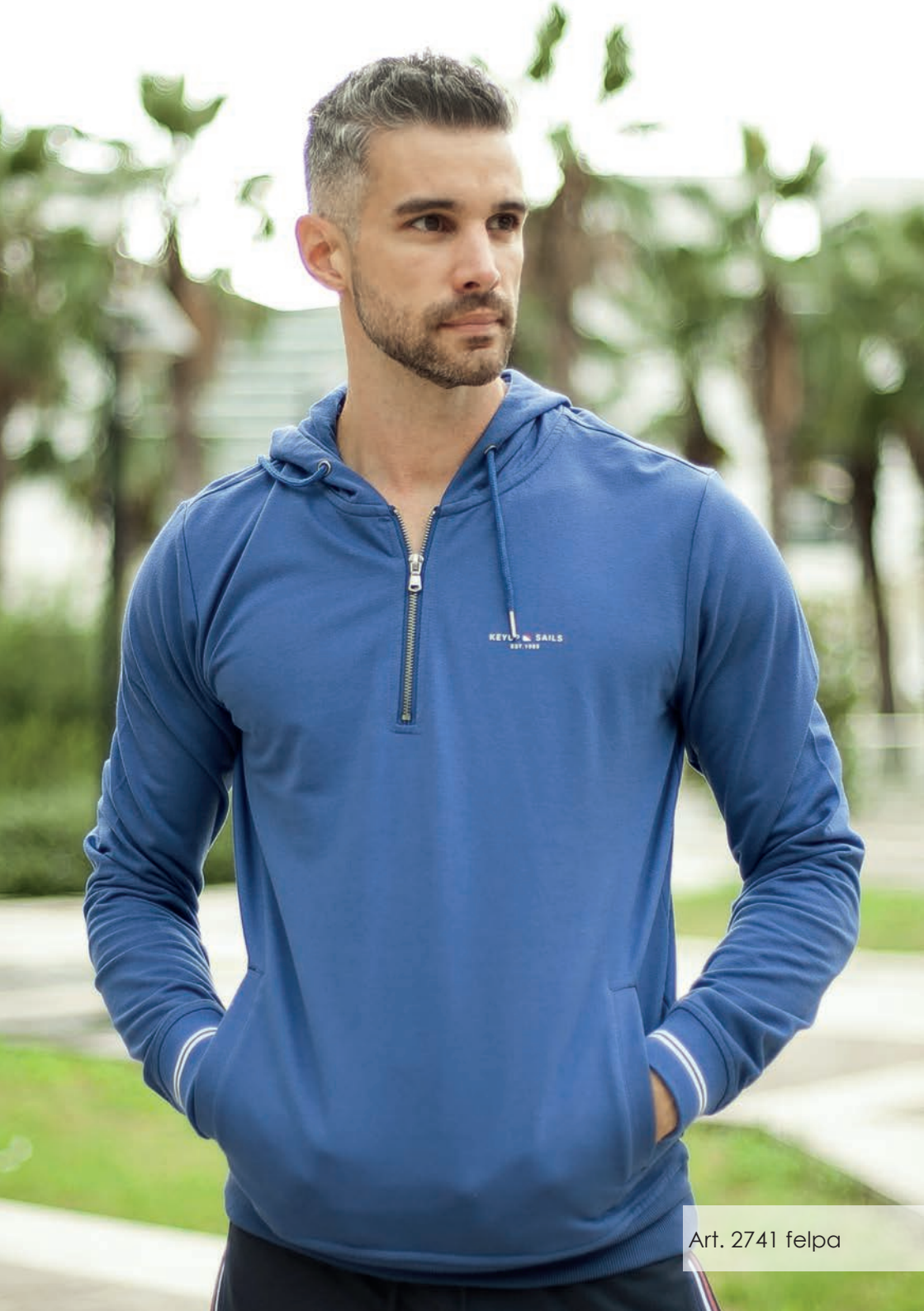
Art. 2741 felpa