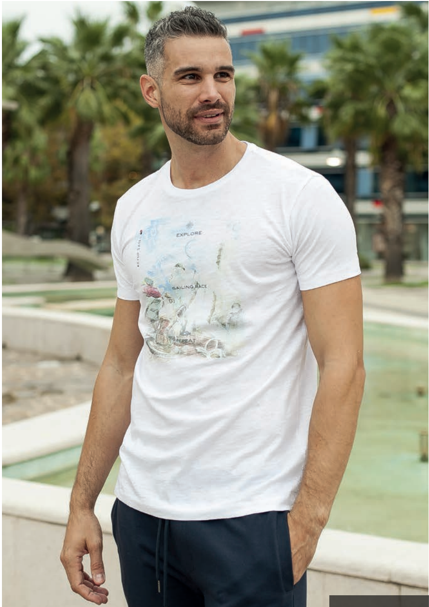
Art. 2723S t-shirt