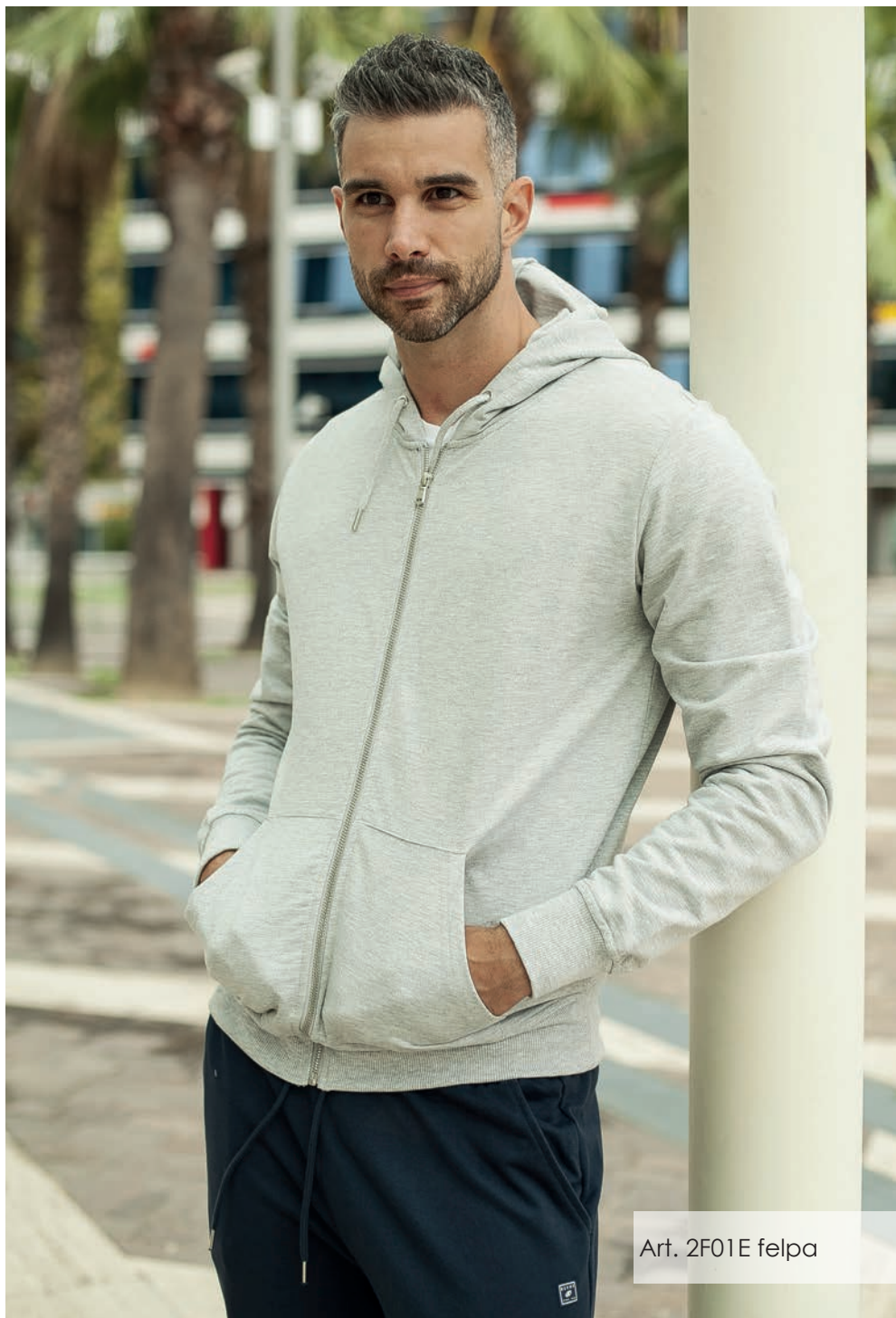
Art. 2F01E felpa