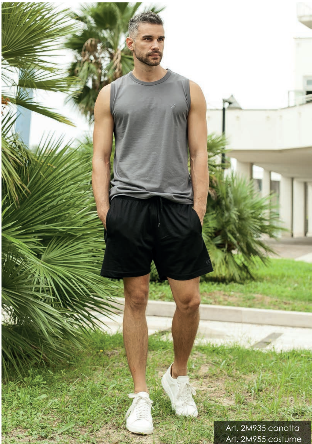
Art. 2M935 canotta Art. 2M955 costume