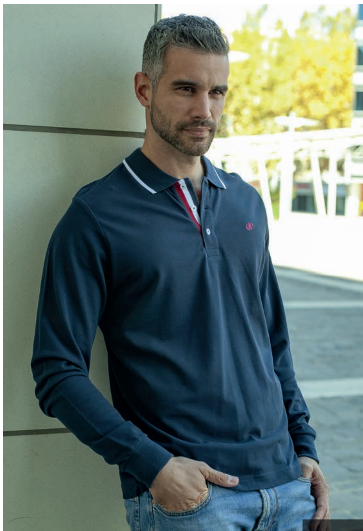
Art. 2L711 polo m/l

“Lo stile e’ l’abito dei pensieri, e un pensiero ben vestito come un uomo ben vestito, si presenta molto meglio.”