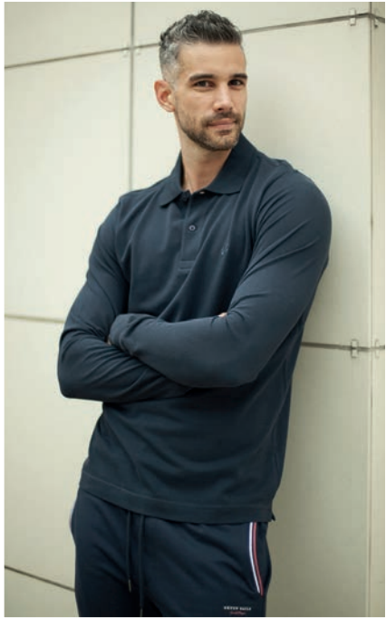
Art. 2Q865 polo m/l Art. 2733F pantalone