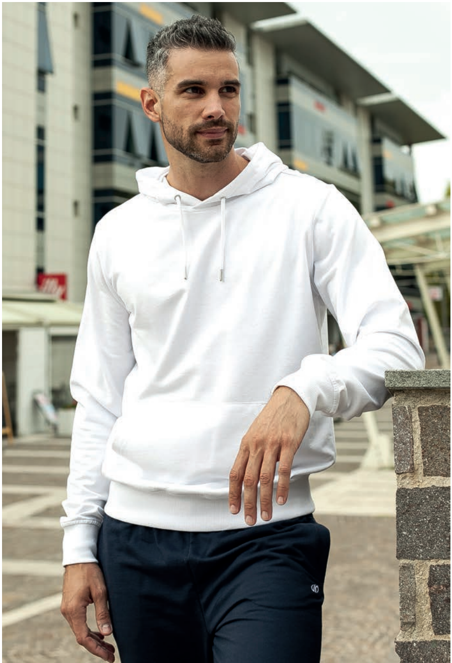
Art. 2F02E felpa Art. 2791T pantalone