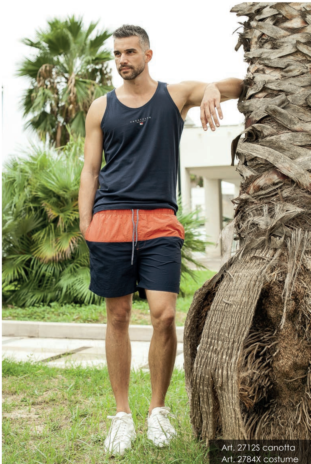
Art. 2712S canotta Art. 2784X costume