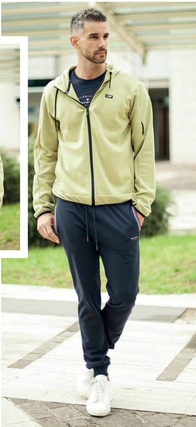
Art. 2772N felpa Art. 2733F pantalone