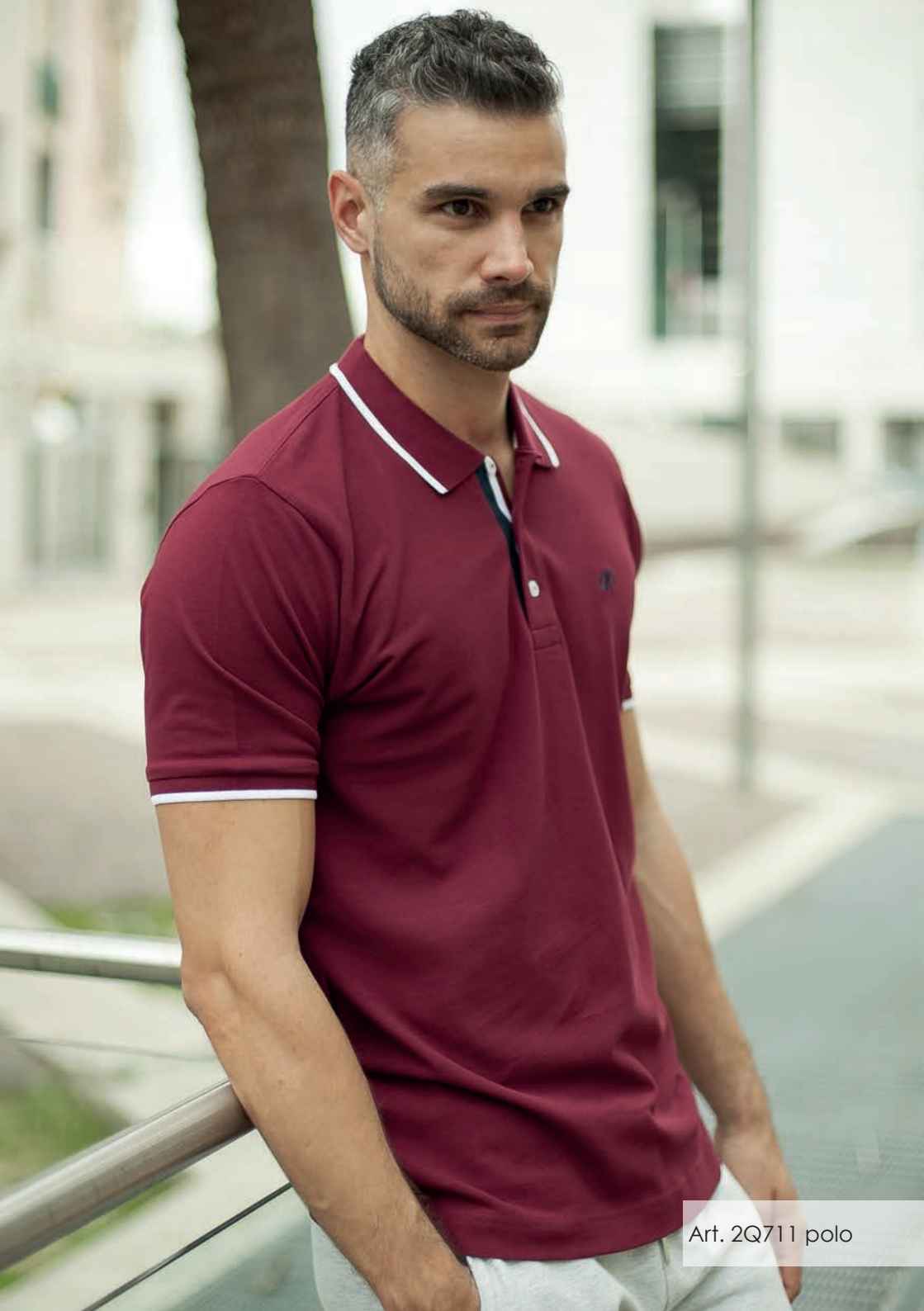
Art. 2Q711 polo