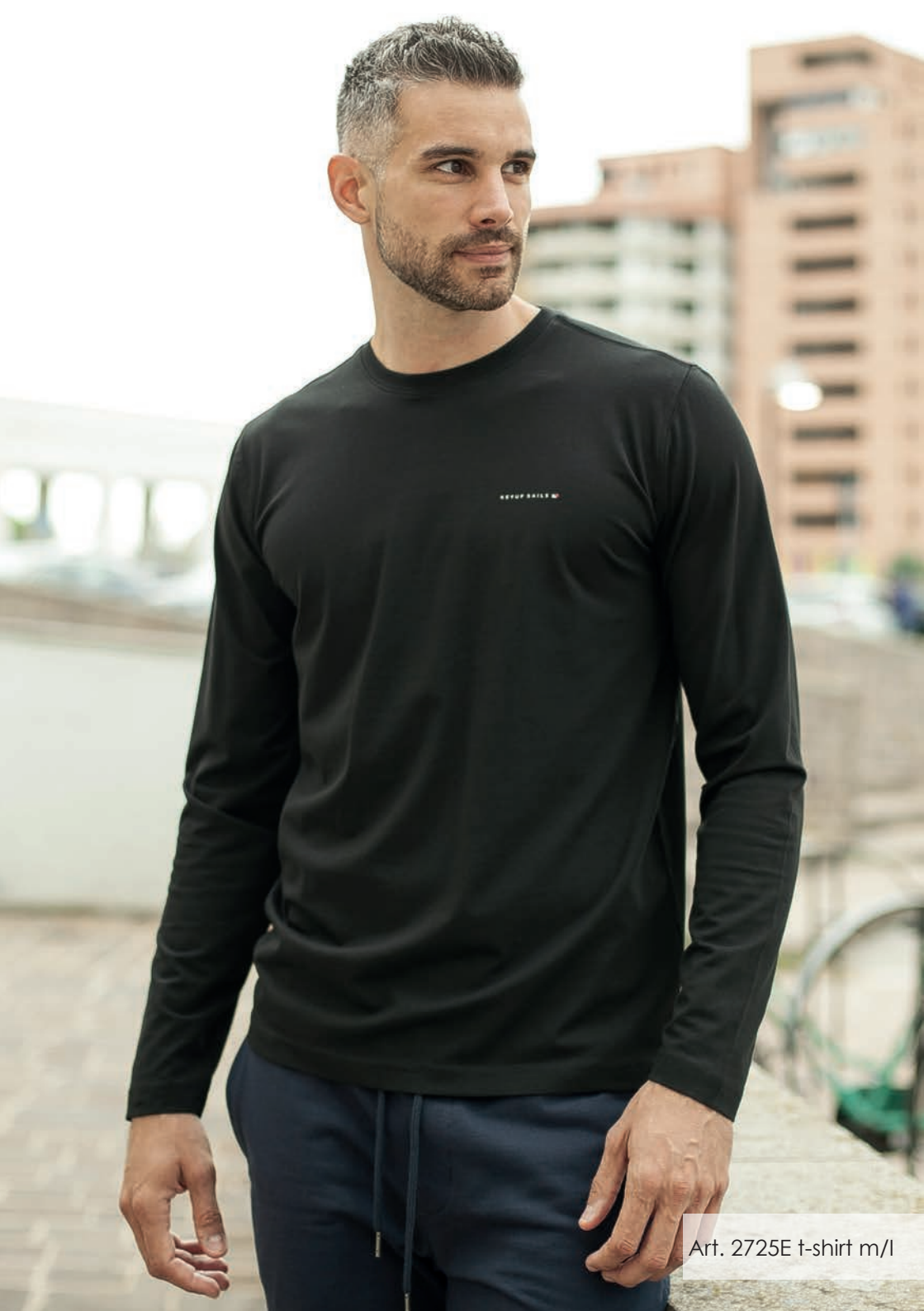
Art. 2725E t-shirt m/l