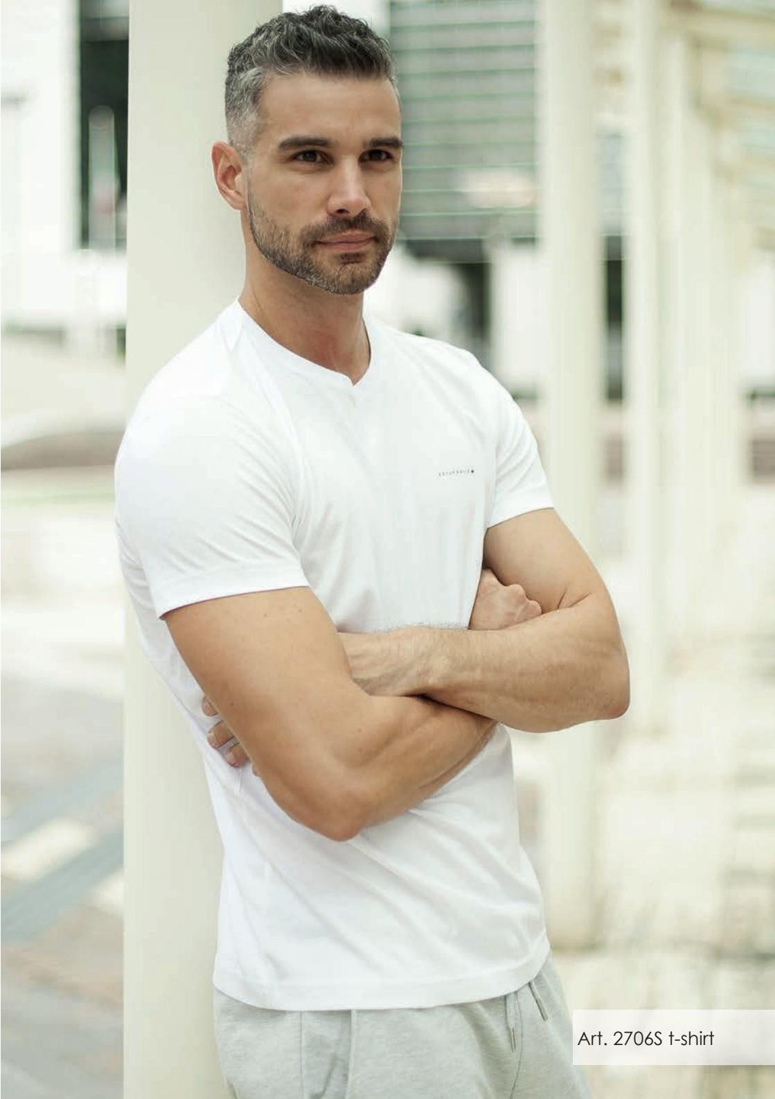
Art. 2706S t-shirt