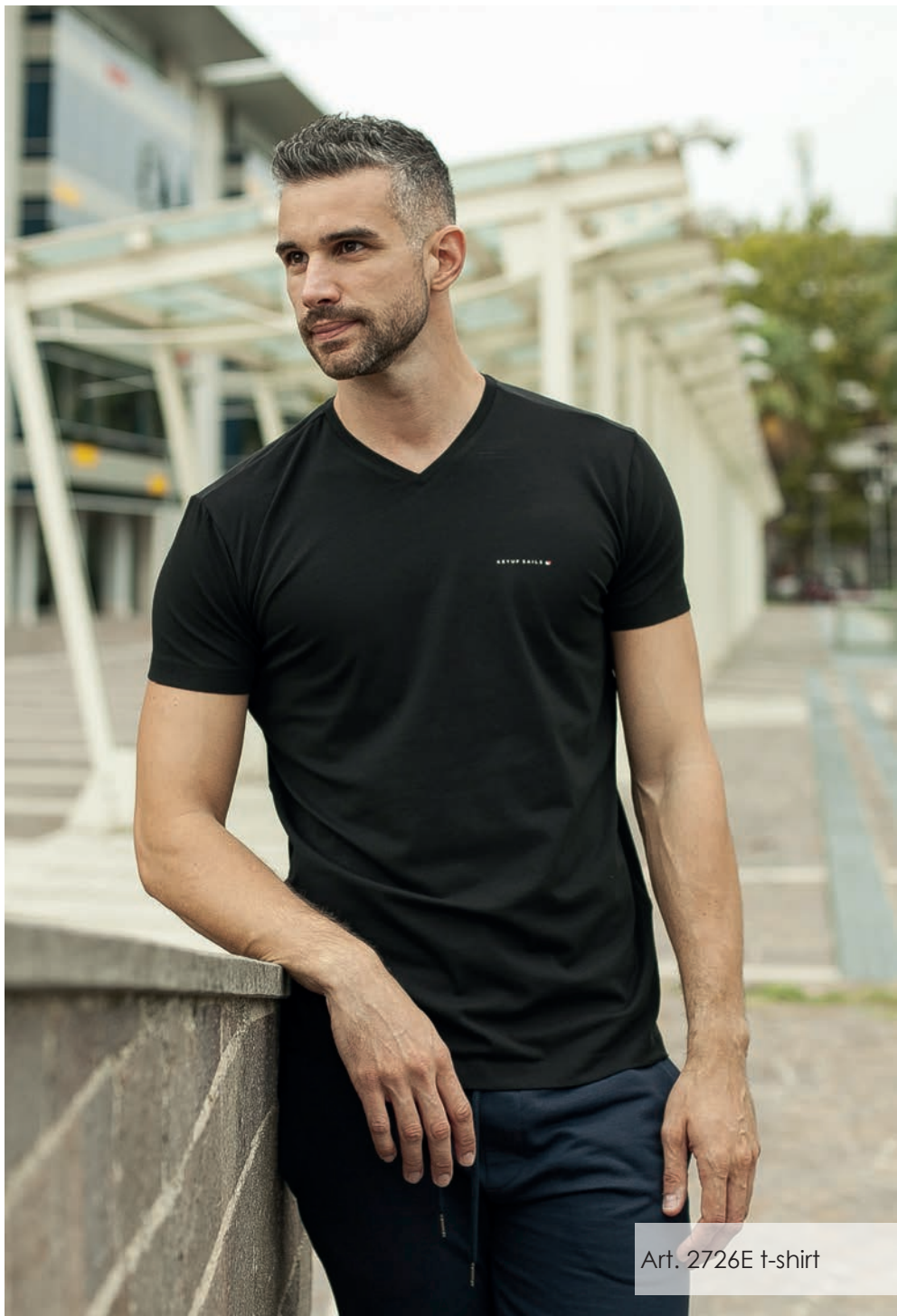
Art. 2726E t-shirt