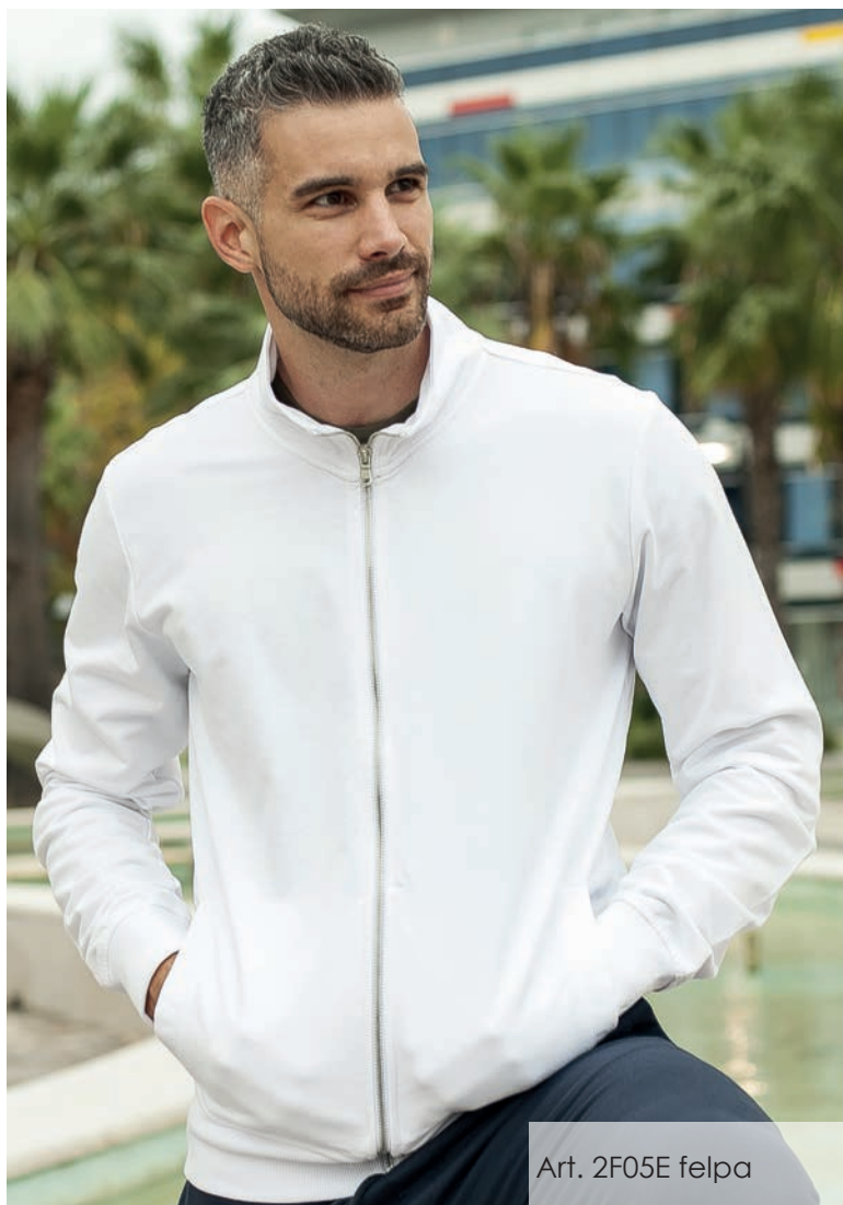
Art. 2F05E felpa

“Ogni nuova moda e’ rifiuto di ereditare, e’sovertimento contro l’oppressione della vecchia moda; la moda si vive come un diritto, il diritto naturale del presente sul passato.”