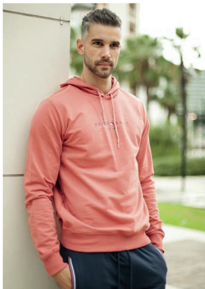
Art. 2735F felpa Art. 2733F pantalone