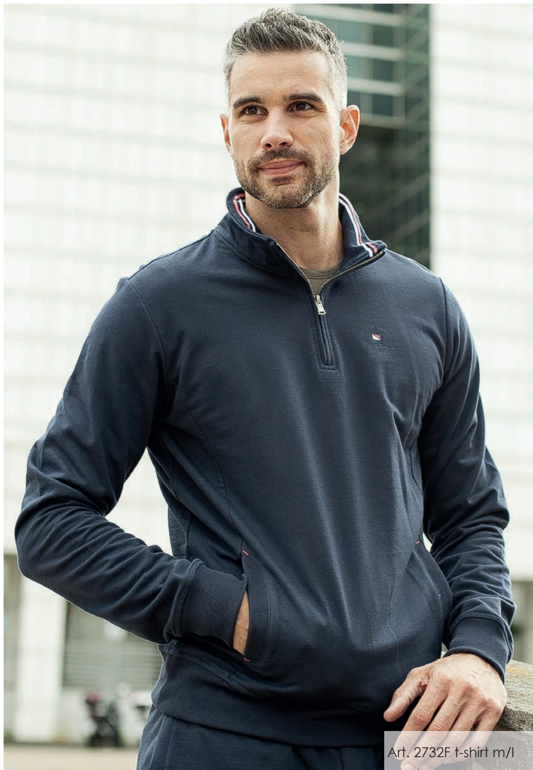
Art. 2732F t-shirt m/l