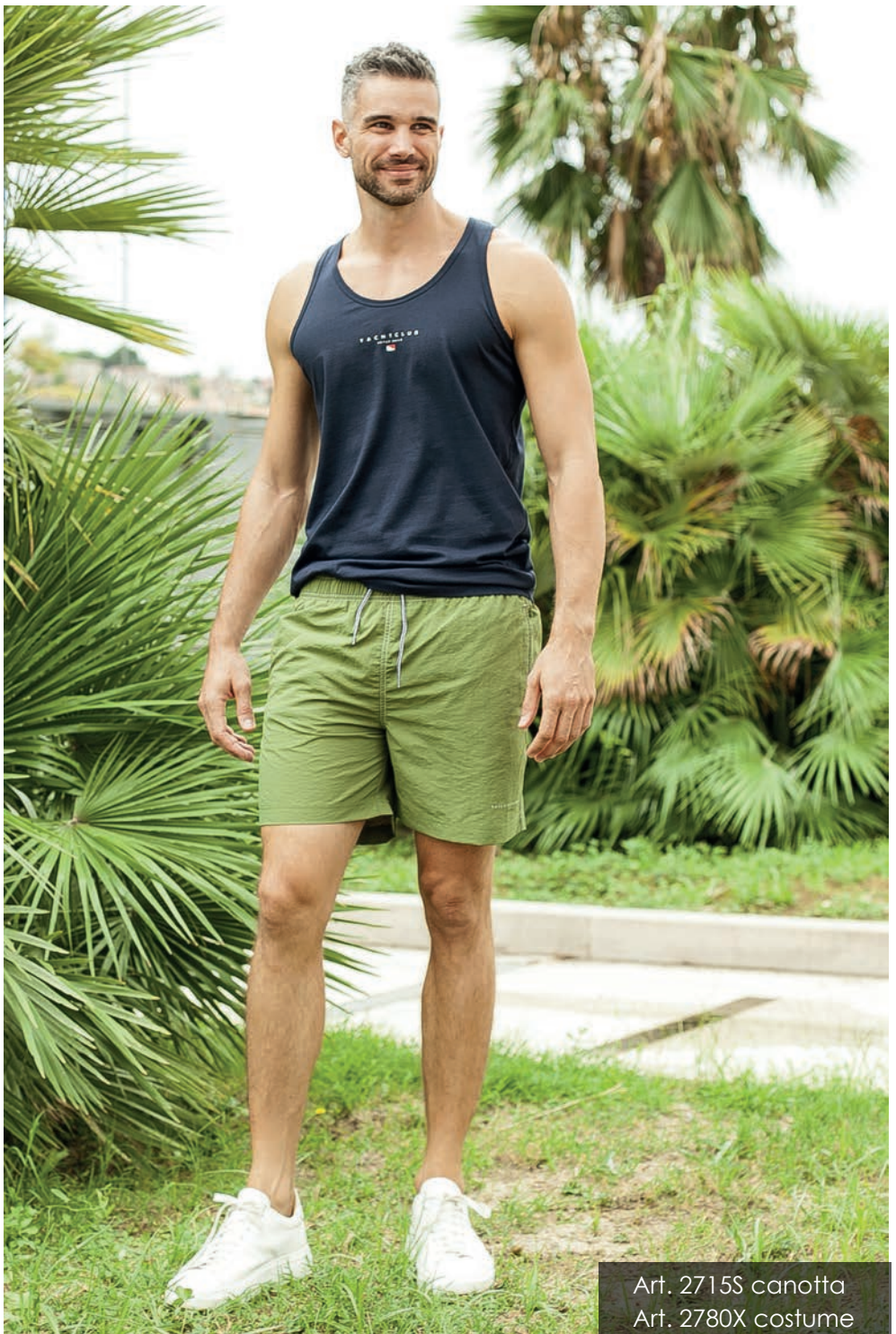
Art. 2715S canotta Art. 2780X costume