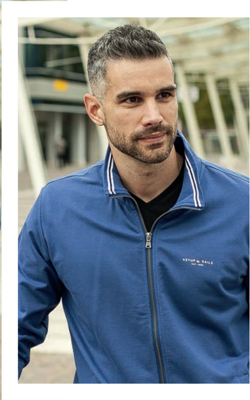
Art. 2742F felpa Art. 2F37E pantalone