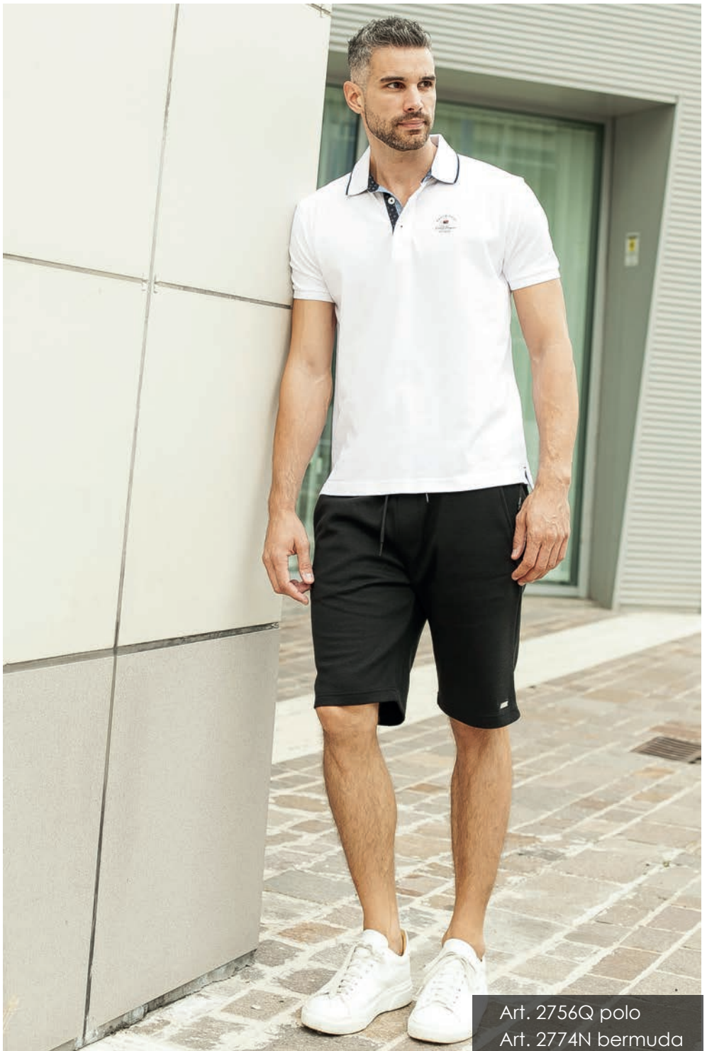
Art. 2756Q polo Art. 2774N bermuda