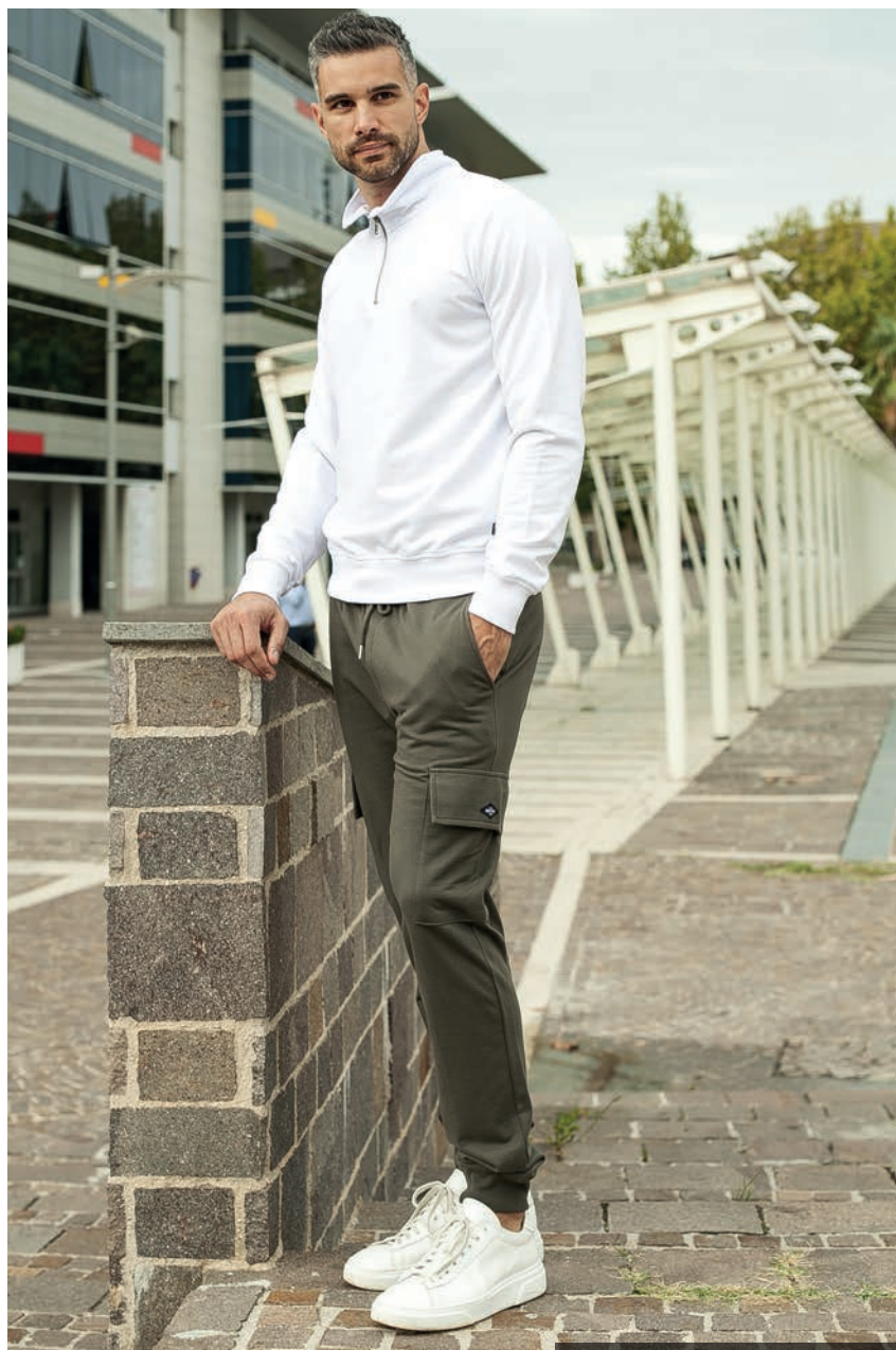
Art. 2F06E felpa Art. 2F883 pantalone

“L'uomo comune si copre. L'uomo elegante si veste.”