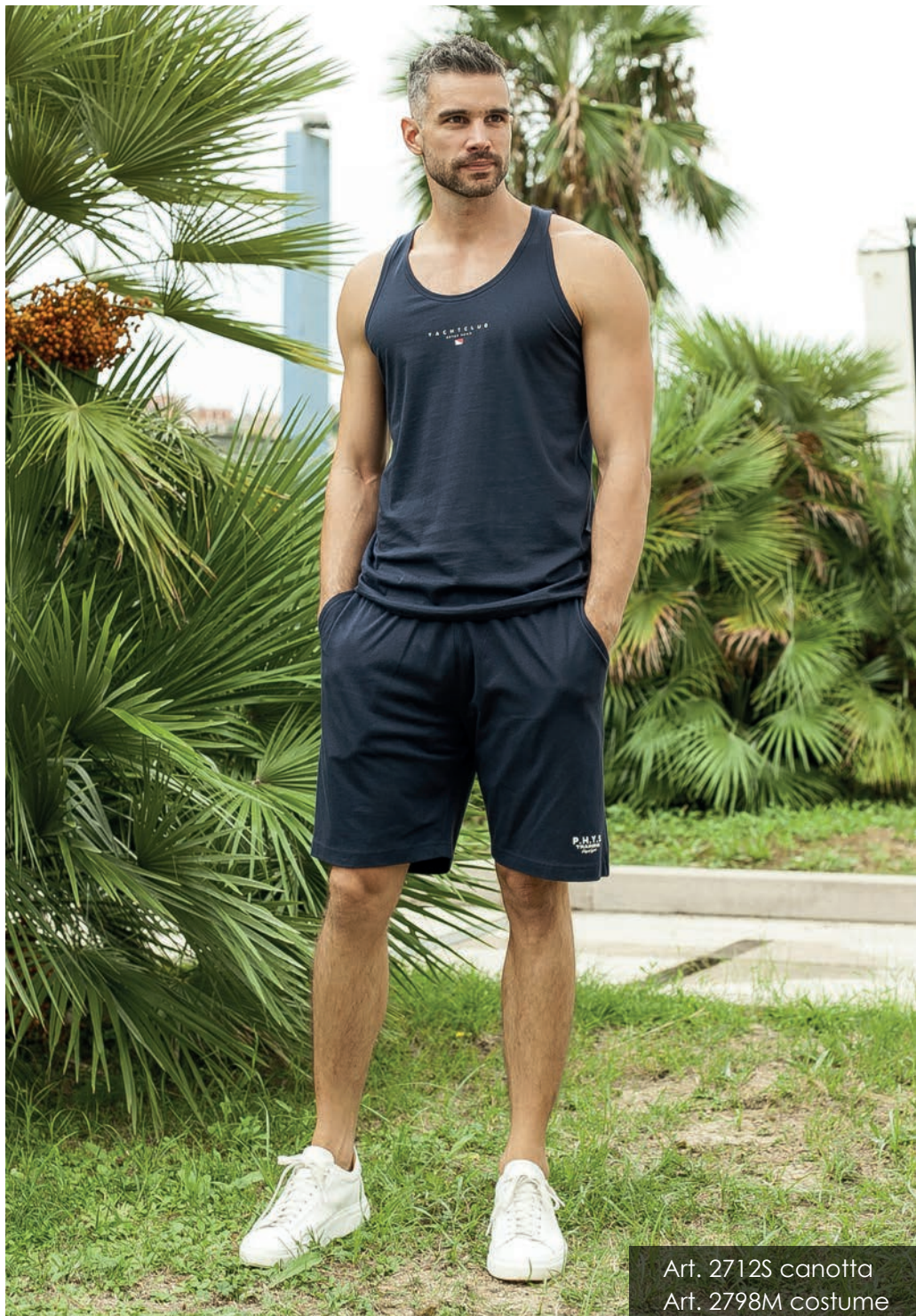
Art. 2712S canotta Art. 2798M costume