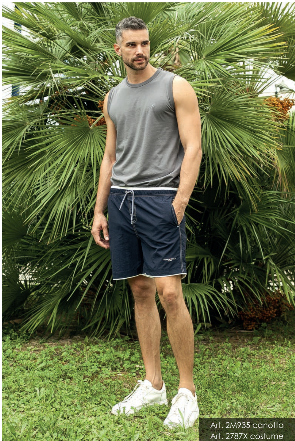
Art. 2M935 canotta Art. 2787X costume